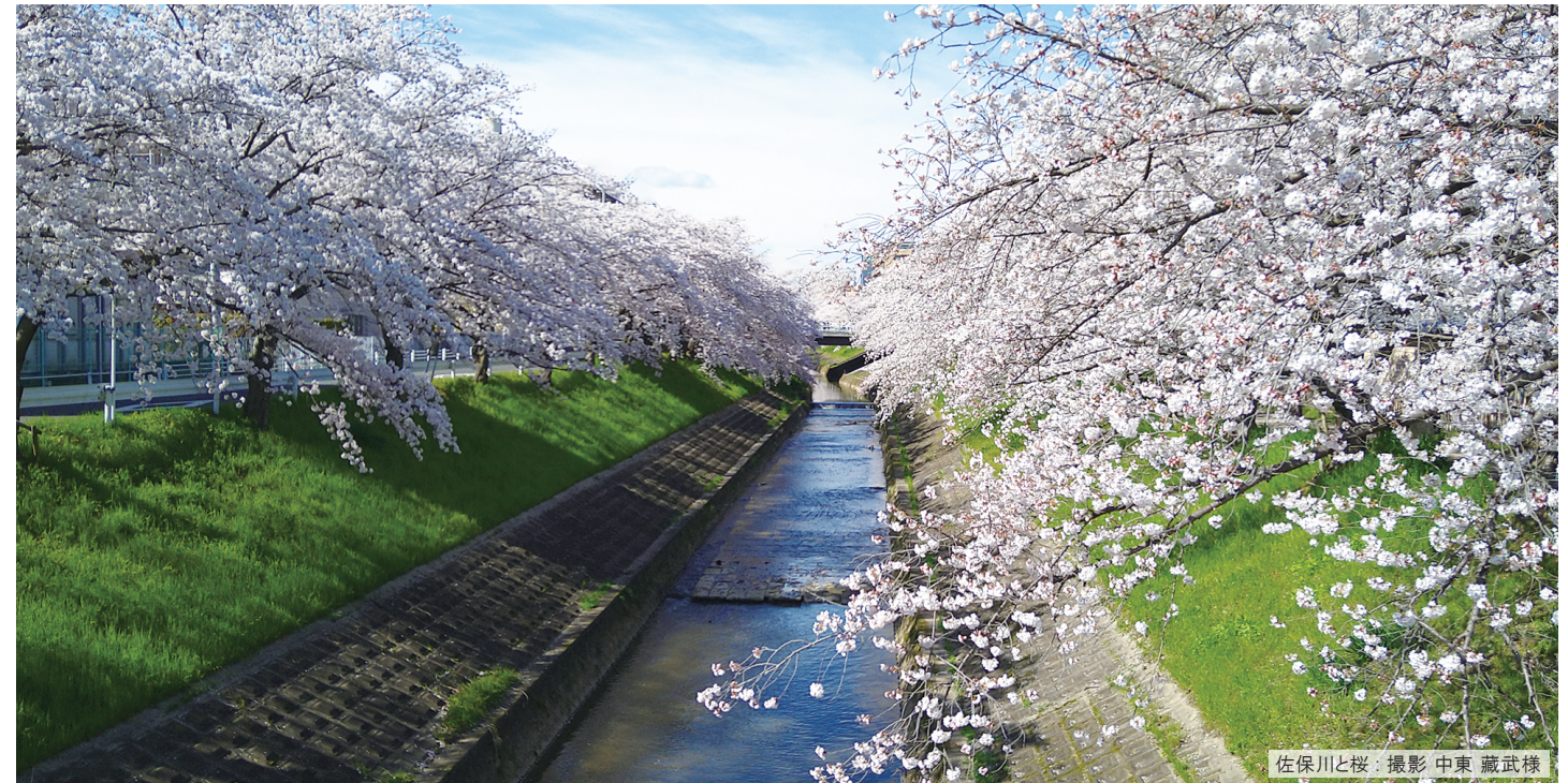
佐保川と桜