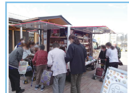
阪急のスイーツ移動販売では お好みのものを喜んで選ばれて いました。