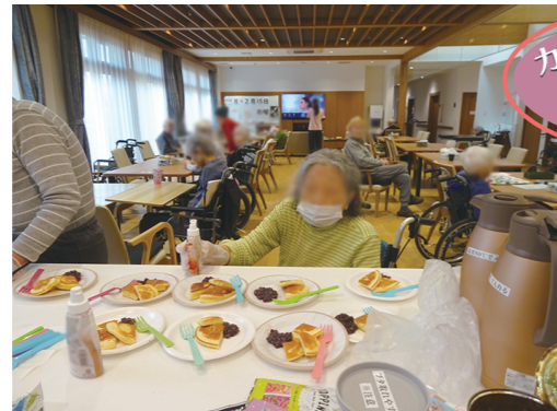
ホットケーキ作り♪ おしゃれに盛り付けやトッピングをして くださいました。