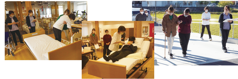
歩行、飲食、排泄などの基本的な身体介助を学ぶことができ、ご利用者の生活を支える幅広い支援ができるようになります。

また、介護福祉士実務者研修についても、今年で第11期の開講に向けて準備を進めています。通信学習とスクーリング(対面授業)を組み合わせることで、働きながらも無理なく資格取得を目指せる環境を整えています。研修は