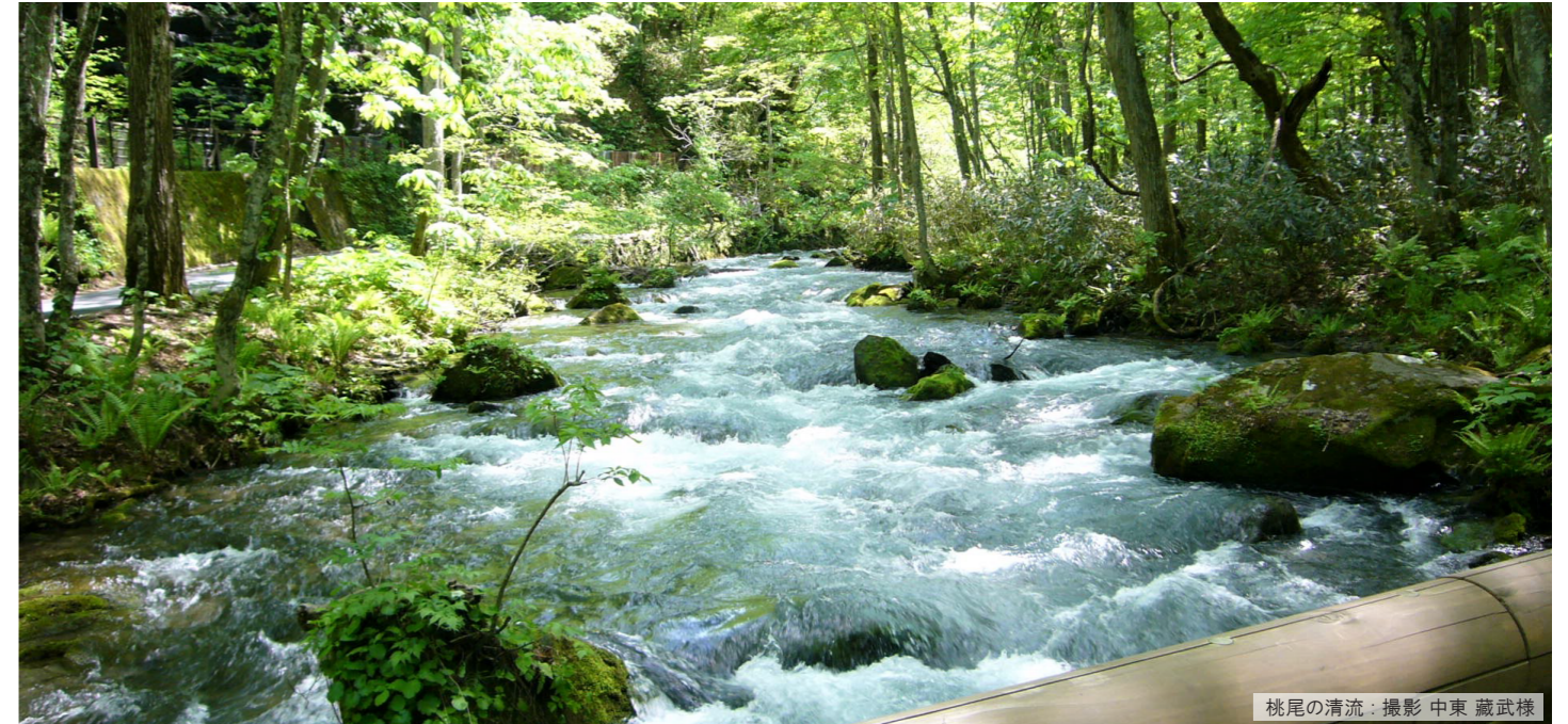
桃尾の清流：撮影 中東 蔵武様

私たちは地域に根差した介護事業を展開する 「株式会社ひまわりの会」「社会福祉法人うねび会」を運営するぽれぽれグループです。 皆さま、スタッフのためのインフォメーション誌「FROMぽれぽれ」を隔月に発行させていただいています。 また、ぽれぽれホームページ( http://www.porepore.co.jp/ )も合わせてご覧いただければ幸いです。