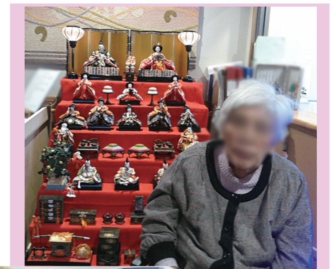
ひな祭りには立派なお雛様が飾られ、ちらし寿司を召し上がって いただきました。