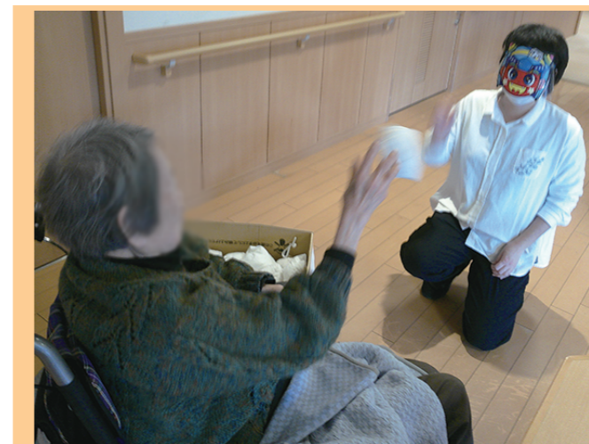
節分には豆まきをし握り寿司を 召し上がっていただきました。