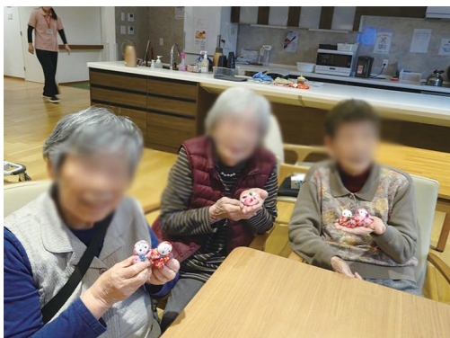
和裁教室で作ったお手玉人形と共に。