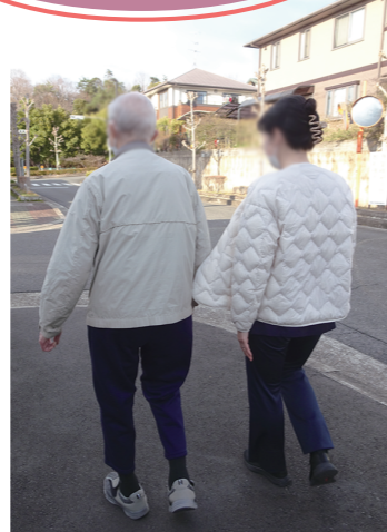
訪問看護で野外の歩行訓練 を取り組んでいます。